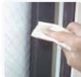
③クロス等で丁寧 にふき取ります。