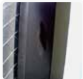
①プライマーが付着 完全硬化した状態。