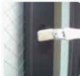
②刷毛等でクリア ツールαを垂れ に注意して塗布。